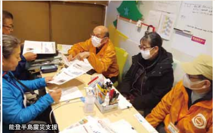
能登半島震災支援