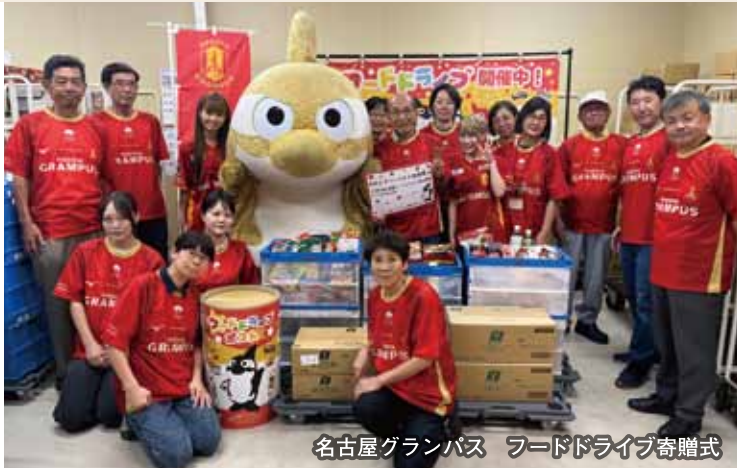
名古屋グランパス フードドライブ寄贈式